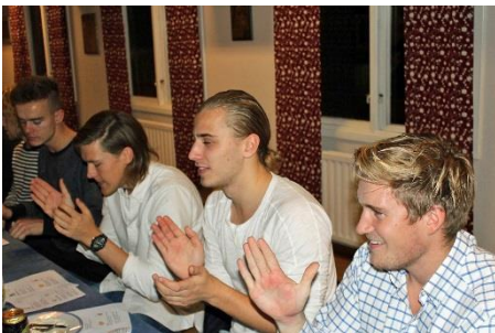
Här ses några av spelarna

Nu har IFK Åmål lagt säsongen 2014 bakom sig. Det skedde genom en avslutningsfest på Kamratgården i lördags. Men man kunde verkligen inte märka att det vara ett lag som åkt ur serien. Nej, tvärtom. Stämningen var fantastisk och spelarna själva bidrog starkt till detta. Det märktes inte minst när de entusiastiskt tog kommandot i de nykomponerade allsångerna, som verkligen föll dem i smaken.